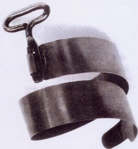
SCHOBINGER CAN OPENER - CCB

Q UAL O LUGAR DA JÓIA, A SUA evolução e a sua constante presença/ausência no quotidiano? De que forma é que a joalheria interfere com outras disciplinas? Quais são as jóias da actualidade – como e quem é que as usa? Foi este o ponto de partida para uma série de acontecimentos, em Lisboa, por ocasião do simpósio de joalheria contemporânea Ars Ornata Europeana (de 7 a 10 Julho).