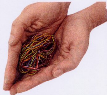
LÚCIA ABDENUR - JOALHARIA IN SITU - IGREJA S.ROQUE

Divulgar o estado actual da joalheria é o tema de exposições, debates e intervenções que, neste momento, se realizam em Lisboa