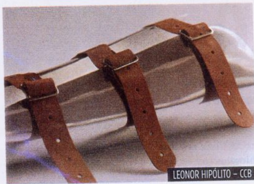
LEONOR HIPÓLITO – CCB